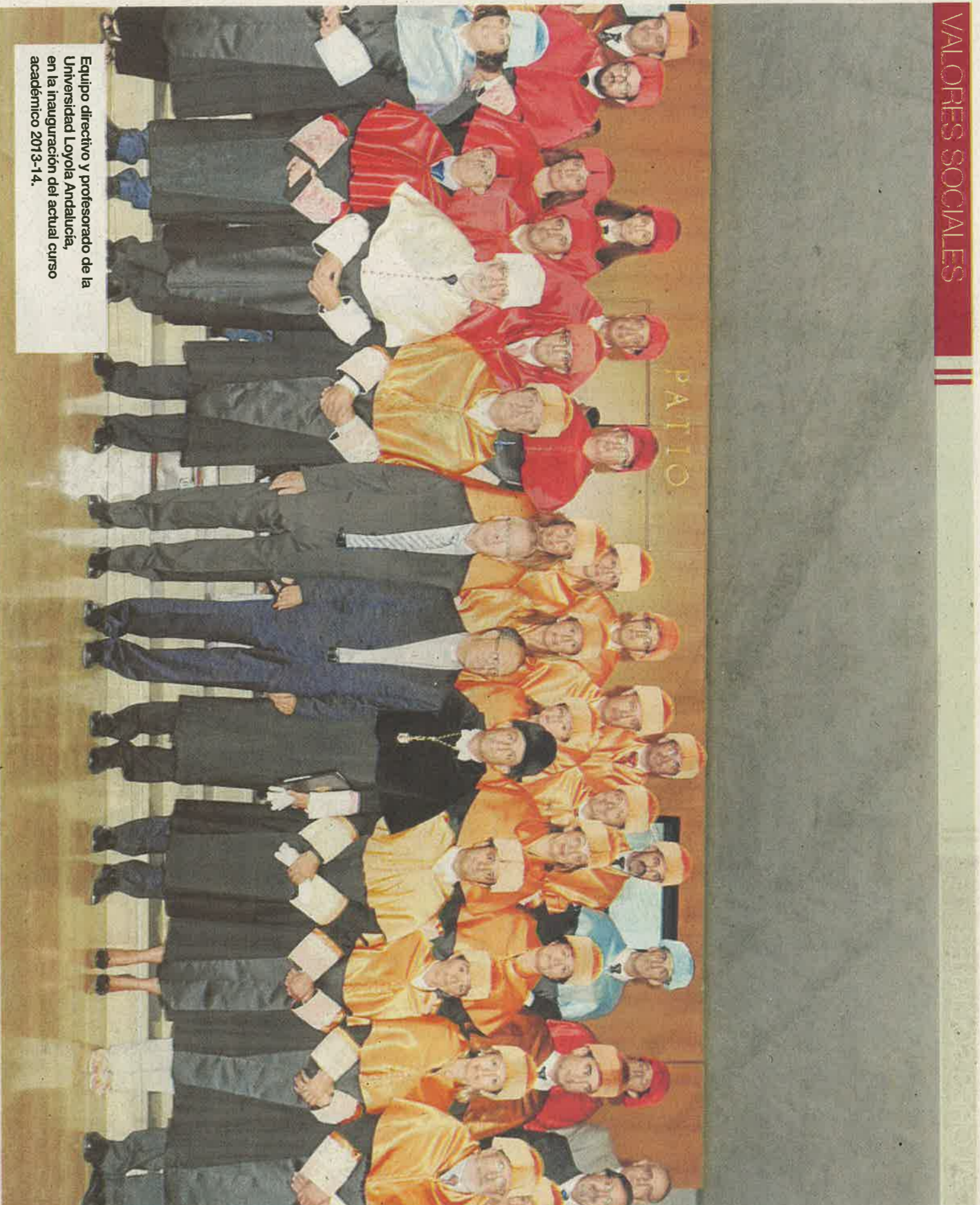
Equipo directivo y profesorado de la Universidad Loyola Andalucía, en la inauguración del actual curso académico 2013-14.